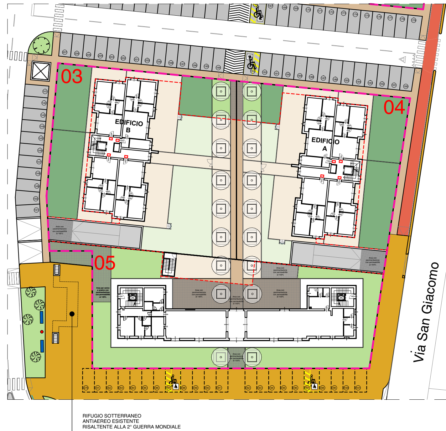
PLANIMETRIA Scala 1:500