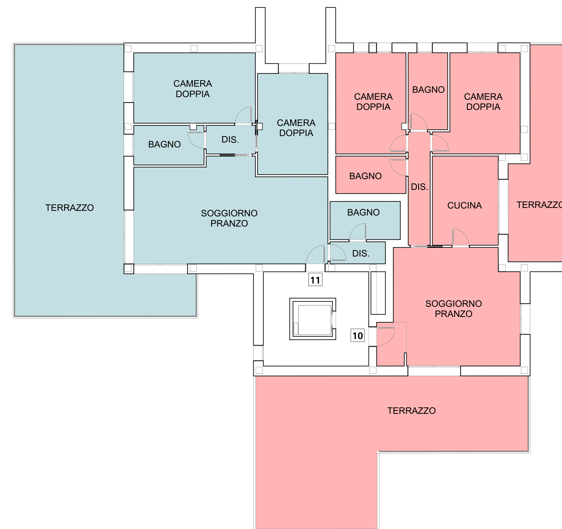
PIANTA PIANO TERZO